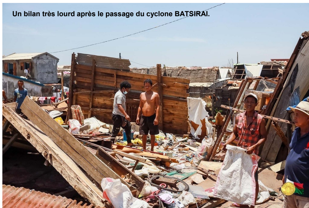
Un bilan très lourd après le passage du cyclone BATSIRAI.

Le bilan provisoire au 10 février en fin de soirée fait état de :